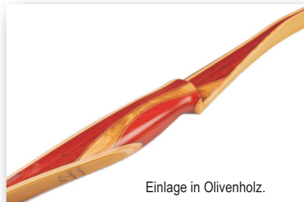
Einlage in Olivenholz.

Die Langbogenserie Giglio von Tuscany Spirit fällt mit 64 Zoll Länge kürzer aus als die Langbogenserie Siena. Weiters weist die Serie Giglio ein aggressiveres Design durch die reflex-deflexe Formgebung (IFAA tauglich) auf. Diese Bogenlinie entspringt wie die Serie Siena exklusiver italienischer Handarbeit in reinster Vollendung. Edles Mittelstück gearbeitet in Padouk und Olivenholz getrennt durch dünne Lamine in Ahorn verleihen dem Bogen ein exklusives, zeitloses und harmonisches Aussehen. Die Wurfarme in Bambus im Dehnungs- und Kompressionsbereich kombiniert mit Douglas und gepaart mit der kurzen, aggressiven reflex-deflex gehaltenen Geometrie geben diesem Bogen seine hervorragende Geschwindigkeit. Durch die ausgetüftelte Materialkombination und Formgebung lässt sich der Giglio Bamboo sehr weich und harmonisch ziehen und vermittelt somit auch bei hohen Zuggewichten ein hervorragendes Gefühl beim Spannen des Bogens und minimiert dabei den Handschock. In der Version Giglio Bamboo + wird im Kompressionsbereich der Wurfarme Osage verwendet, welches den Giglio in dieser Version noch etwas schneller macht. Erhältlich in 64" inklusive handgefertigter FF-Sehne, Pfeilaufgabe und Bogenhülle.