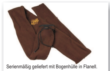
Serienmäßig geliefert mit Bogenhülle in Flanell.