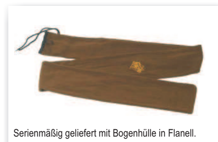
Serienmäßig geliefert mit Bogenhülle in Flanell.