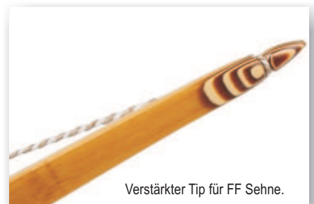
Verstärkter Tip für FF Sehne.